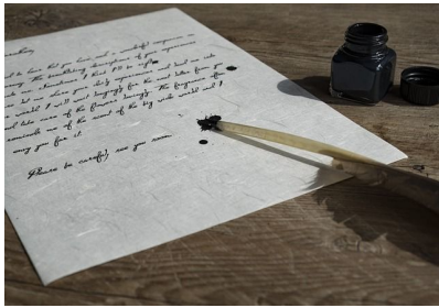
I 95 B.C.